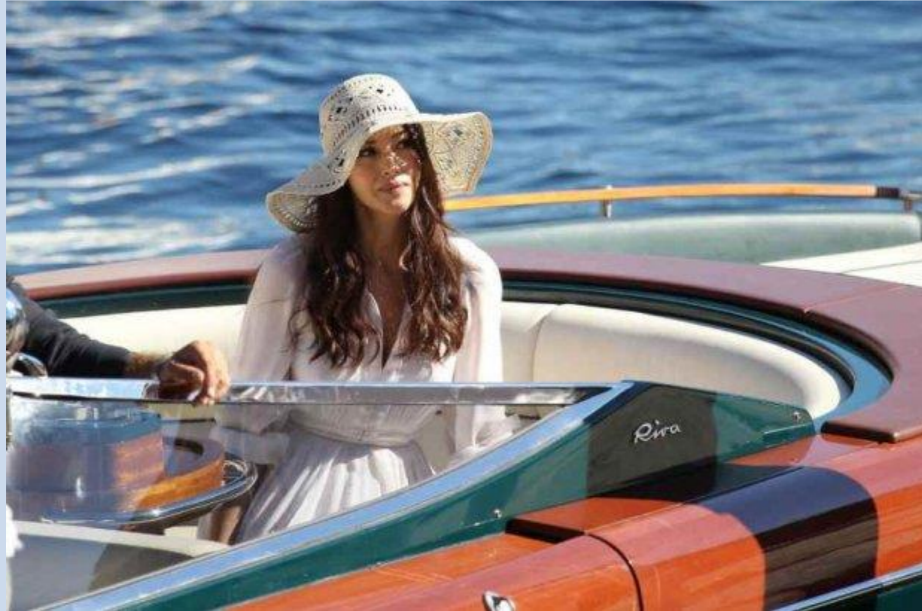
Monica Bellucci in barca Riva in Portofino – „Cisowianka Perlage - Aqua polacca di qualita superiore”.